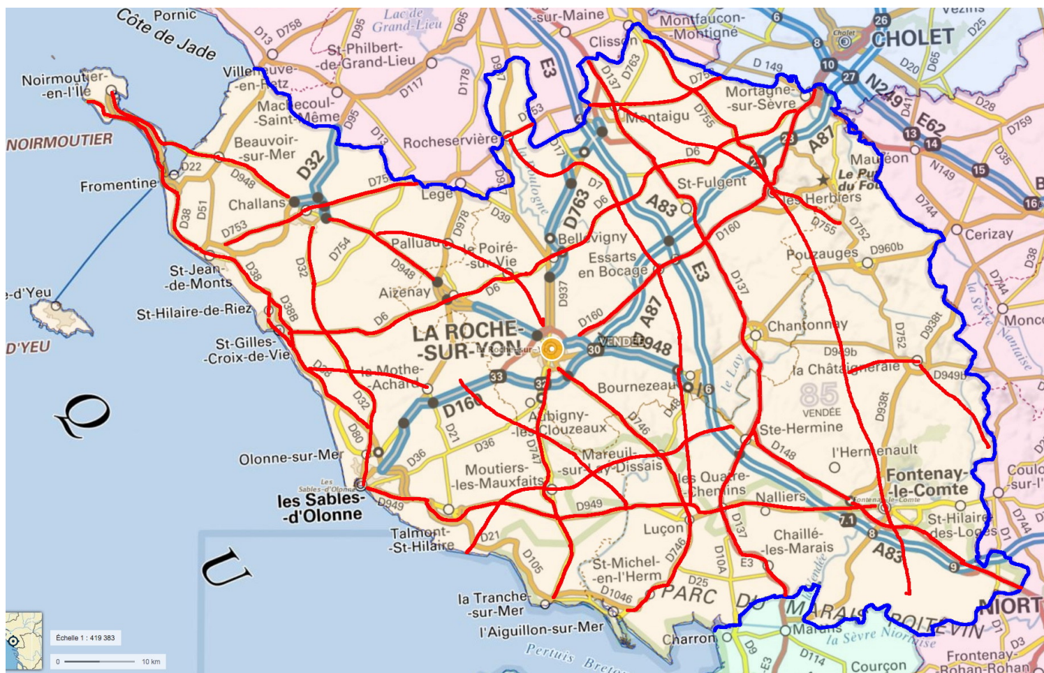
Carte des voies

Les 16 voies où ont été observé le plus de tués, représentant un peu plus de 21% de la longueur totale des routes sans séparateur médian, concentrent 51% des tués.